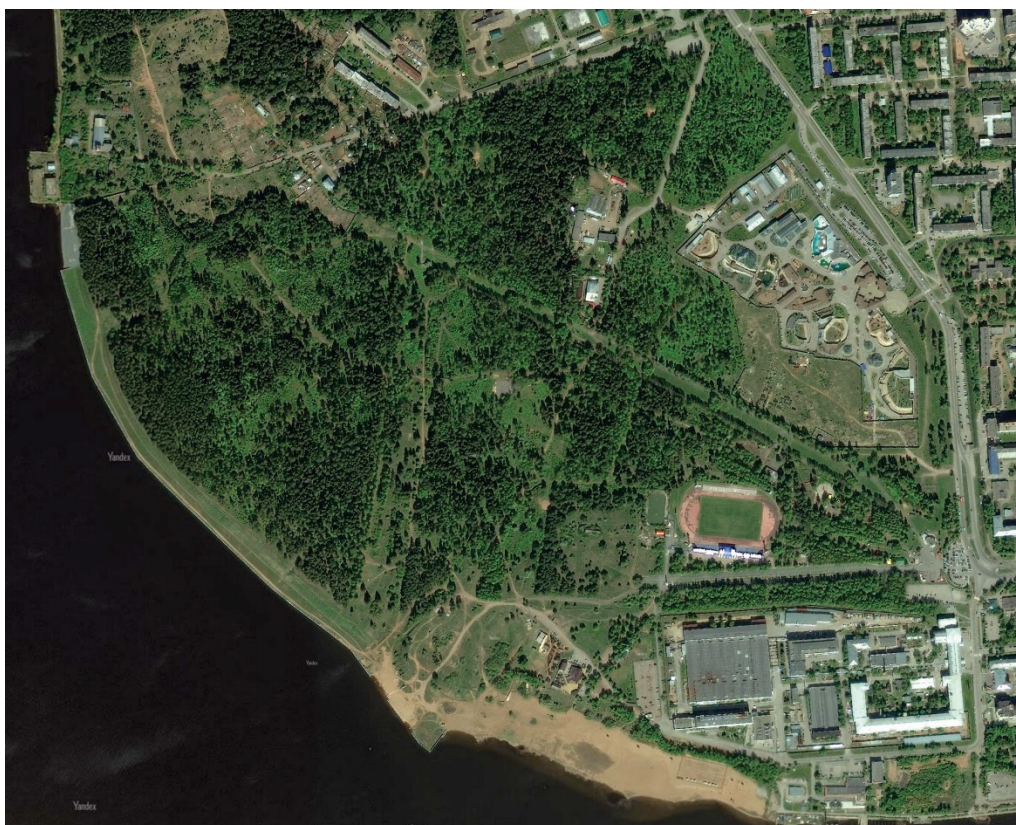
Парк им. С. М. Кирова в Ижевске. Спутниковая съёмка.

Парк им. С. М. Кирова в Ижевске. Границы проектируемой территории. Красным обозначены границы парка. Желтым закрашена территория парка. Белые включения на схеме — это земля, не относящаяся к парку, находящаяся в частной, республиканской или федеральной собственности; её использование при создании конкурсного проекта нужно исключить.